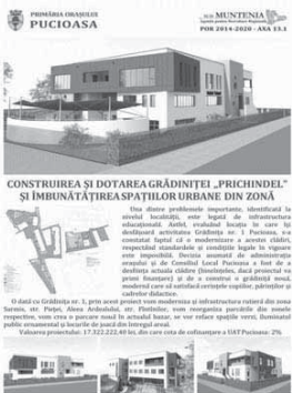
CONSTRUIREA ȘI DOTAREA GRĂDINTEI „PRICHINDELE” ȘI ÎMBUNĂTĂȚIREA SPAȚIILOR URBANE DIN ZONĂ

"Este ușor sa fii un primar bun atunci când ai un buget consistent la dispozitie!" Atunci când bugetul de dezvoltare al localității nu acoperă nici 2-3 procente din sumele necesare la nivelul orașului, administrația are obligația să caute și să identifice surse de finanțare pentru necesitățile comunității! Și nu e deloc simplu! Problemele orașului le știm foarte bine (și din păcate în fiecare zi identificăm unele noi!) La fel de bine cunoaștem și dimensiunea bugetului!