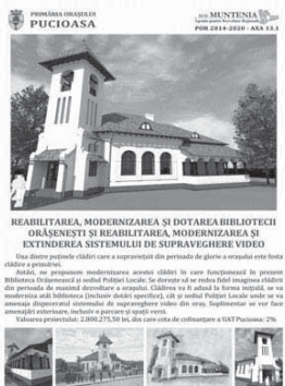
REABILITAREA, MODERNIZAREA SI DOTAREA BILIEI TECTEI ORASENEI SI REABILITAREA, MODERNIZAREA SI EXTINDEREA SISTEMULUI DE SUPRAVEGHERE VIDEO