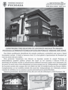
CONSTRUIRE TREI BLOCURI CU LOCUINTE SOCIALE IN ORASUL PUCIOASA SI IMBUNATATIREA SPATIILOR PUBLICE URBANE DIN ZONA