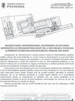
REABILITAREA, MODERNIZAREA, EXTINDEREA SI DOTAREA GRĂDINTEI CU PROGRAM PREDINȘTIT NR. 2 DIN ORAȘUL PUCIOASA ȘI ÎMBUNĂTĂȚIREA SPAȚIILOR PUBLICE URBANE DIN ZONĂ