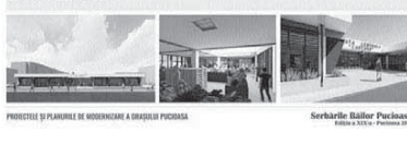
PROIECTE ȘI PLANURI DE MODERNIZARE A ORAȘULUI PUCIOASA Serbările Bailor Pucioasa