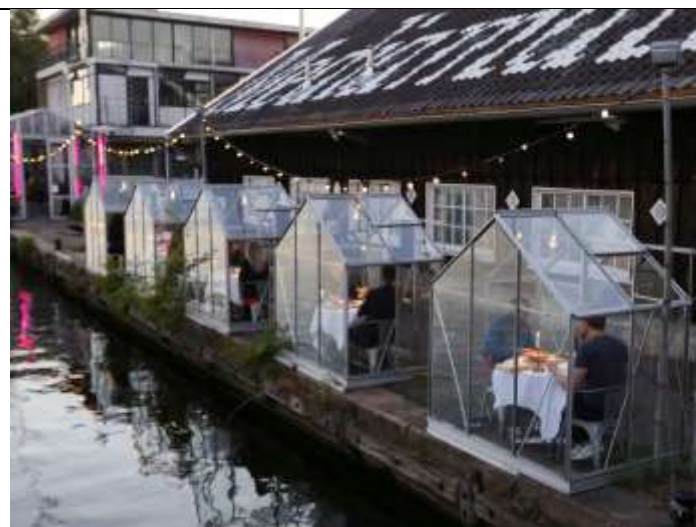
Căsuțe protectoare (Amsterdam)