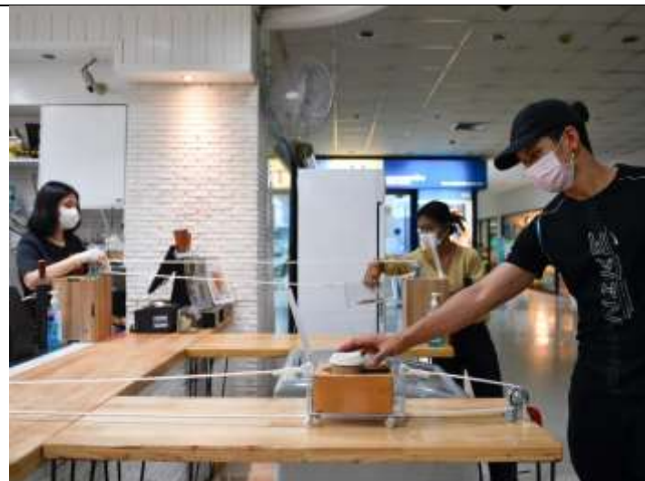
Noul mod de a primi cafeaua (Bangkok)