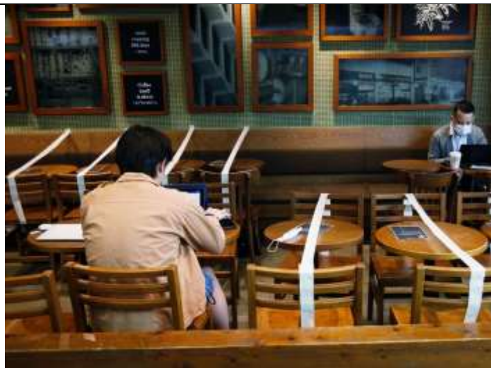
Bandă protectoare lipită pe mese pentru a asigura distanțarea socială (Bangkok)